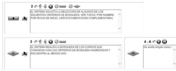
Fig. 4. Bifurcación en la especificación de trazo fino de un Caso de Uso.

Partiendo de un estado/nodo origen, en la función de transición puede estar asociado solamente uno de los símbolos: A, N o S. Con esto se cumple la condición necesaria de un autómata finito determinista. De esta manera, si la transición entre dos estados/nodos se da dentro de un mismo camino, se asocia el símbolo A. Si en cambio interviene una bifurcación, la función de transición hacia el estado/nodo destino por cumplimiento de la condición de bifurcación, se asocia el símbolo S. Por el otro camino de la bifurcación, se asocia el símbolo N.