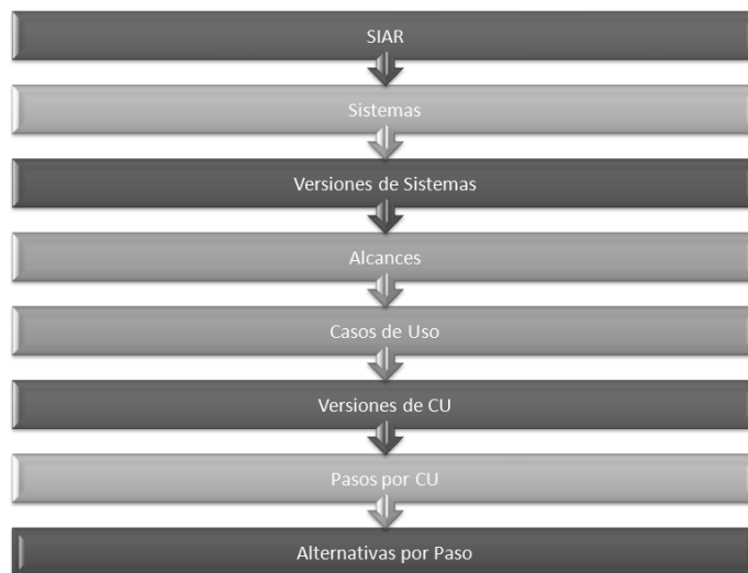
Fig. 1. Relaciones de SIAR..

La herramienta ha sido diseñada con un criterio de lógica que permite describir la siguiente relación de cascada: